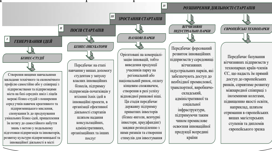
Рис. 1. Система «інноваційного ліфта» дозволить підвищити якість освіти і наукових досліджень, продуктивність праці, сприятиме прискоренню строків виведення інноваційних розробок на ринок та, зрештою, забезпечить єдність регіональної інноваційної системи

Польщі, вони спочатку адаптують свій малий бізнес у відповідному польському технопарку, тим самим вони стають вже резидентами ЄС. Це надає їм можливість виходу як на досить ємний польський, так і загальноєвропейський ринок, не пориваючи зв'язків з Україною та її ринком.